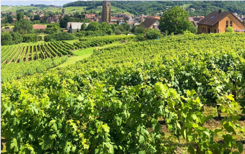
Arbois, Capitale des Vins du Jura