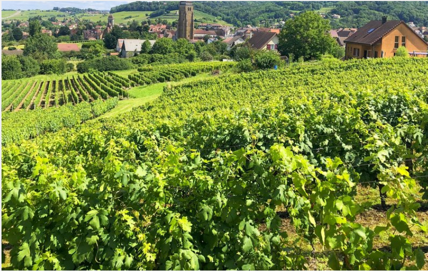
Arbois, Capitale des Vins du Jura