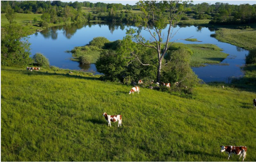
Etang d'Arsure-Arsurette