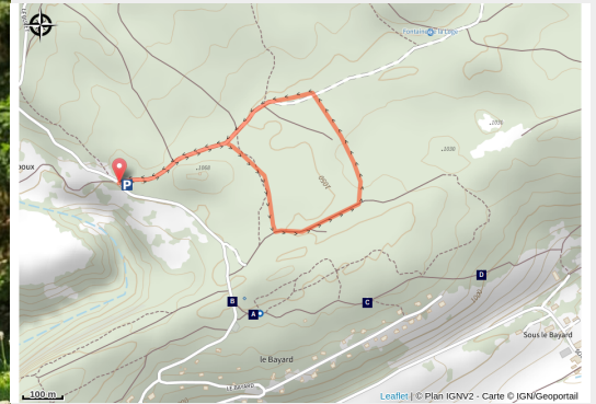
VTT dans la forêt du bois de Croz au dessus de Fonceine-le-Haut

C'est un circuit d'initiation à la pratique du VTT, sans grosse difficulté, ni dénivellation importante. À faire en famille, avant de parcourir des circuits plus longs.