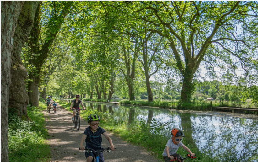
Famille à VTT autour de Dole