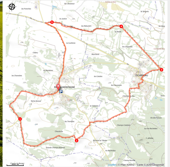
Paysage du Premier Plateau

Au départ des villages du Premier Plateau du Jura, Fay-en-Montagne ou Picarreau, le circuit « Les Puits Romains » est l'occasion d'une agréable balade à VTT, accessible à tous.