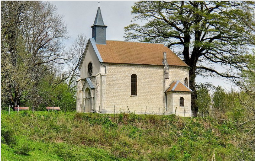
Chapelle Saint Maximin à Foucherans