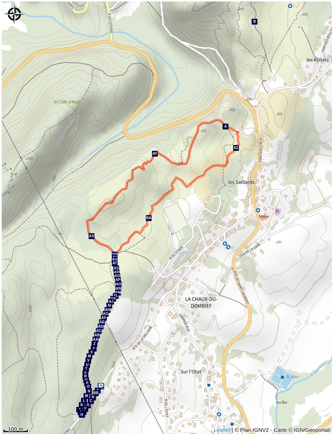
Vue sur le Pic de l'Aigle (A)