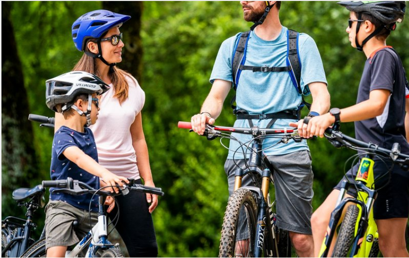
Famille en VTT dans le Grandvaux