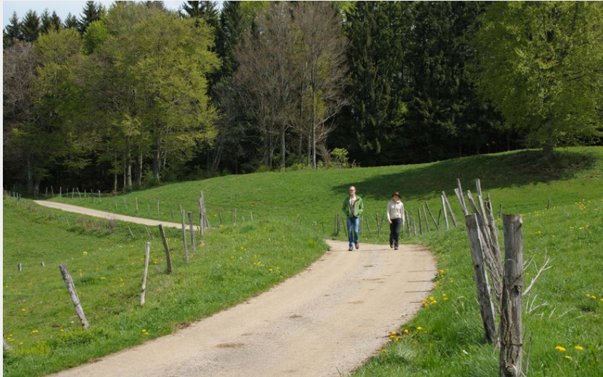
Randonnée La Source à Saint-Laurent en Grandvaux