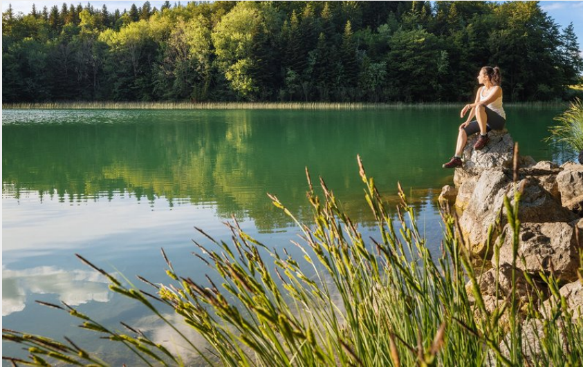
Randonnée au lac du Maclu