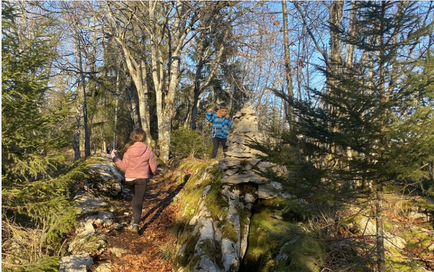
Sentier des Cairns (Florian Spicher)