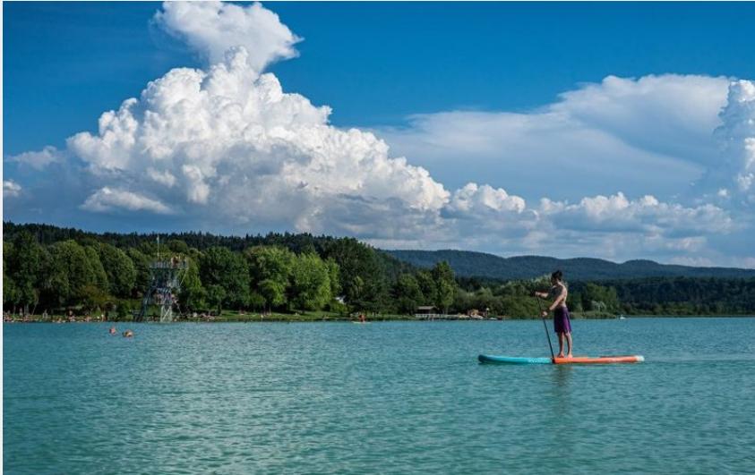
Lac de Clairvaux