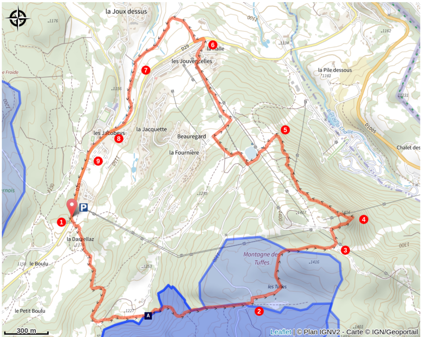
La Forêt du Massacre (A)