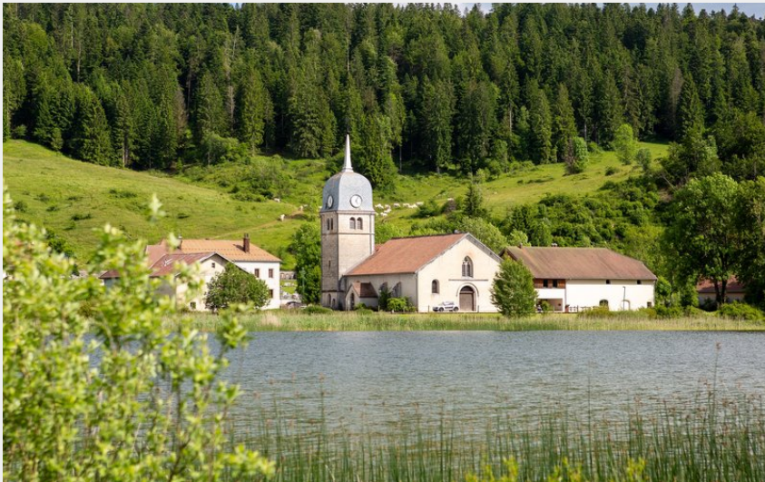
Lac de l'Abbaye en Grandvaux