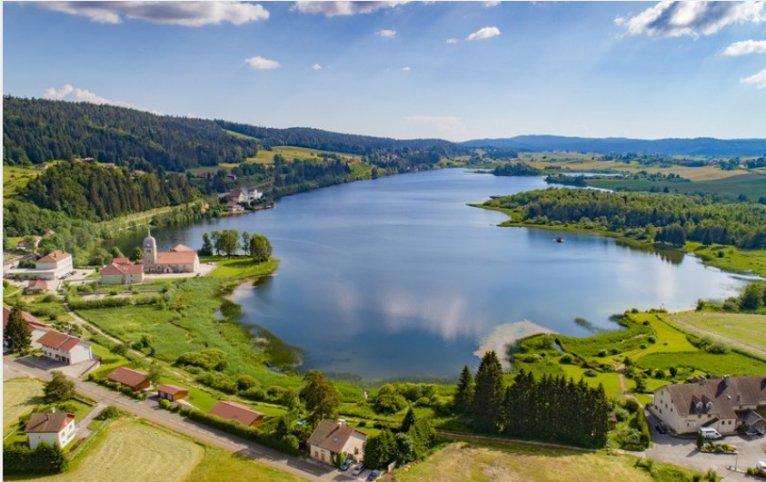
Lac de l'Abbaye en drone