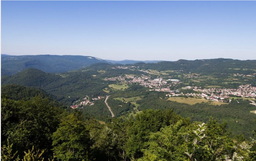
Belvédère de Ponthoux