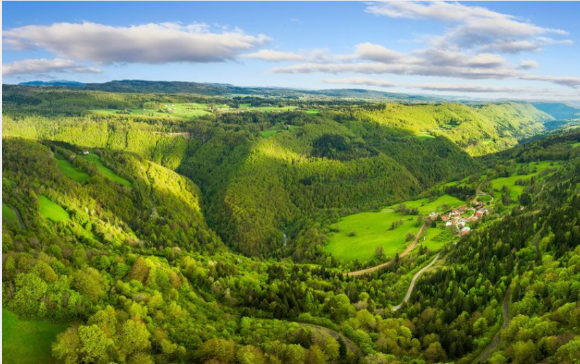
La vallée de la Bienne