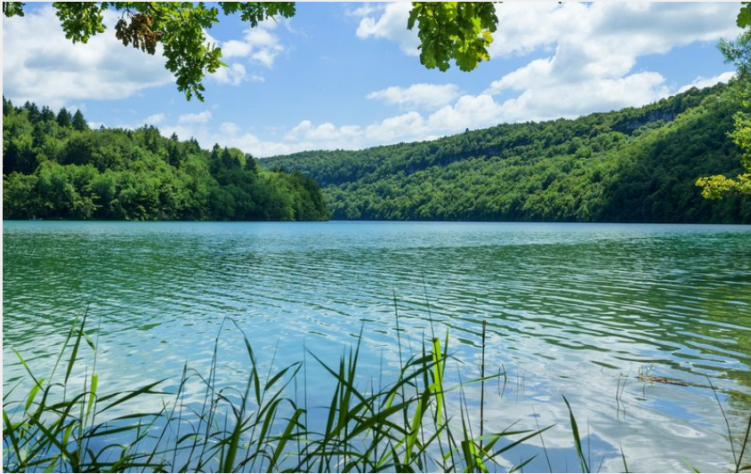
Lac de Vouglans