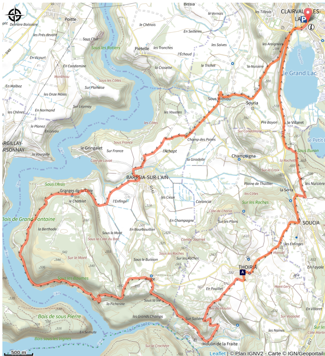
Fruitière 1900 (A)