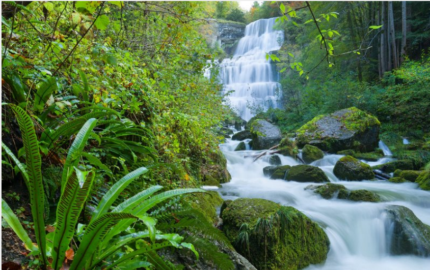
Les cascades du Hérisson - l'Eventail