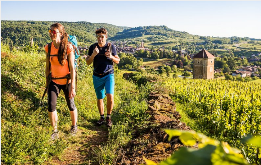
Randonneurs à Arbois