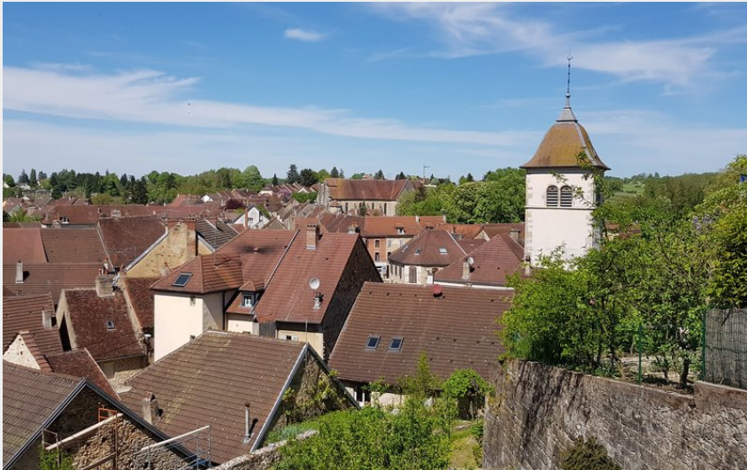
Village de Sellières