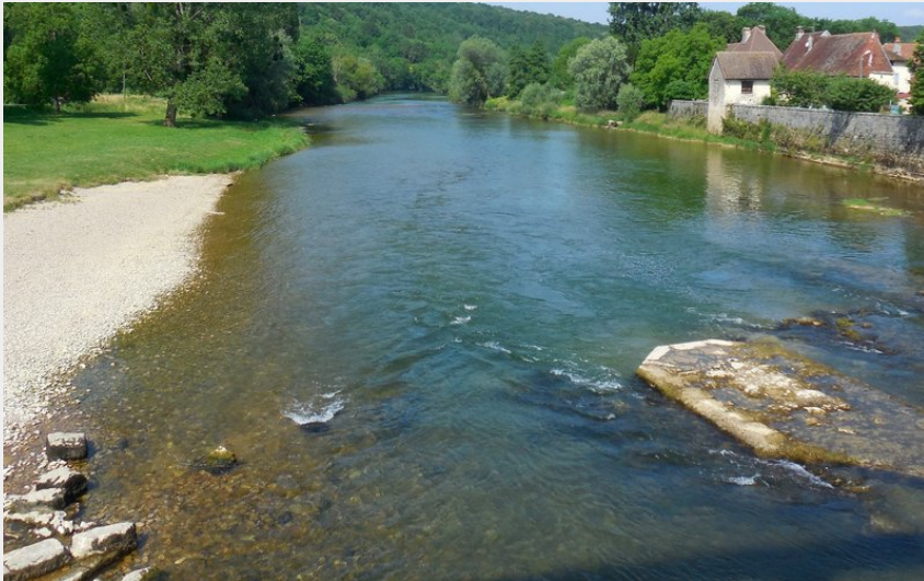
Port Lesney