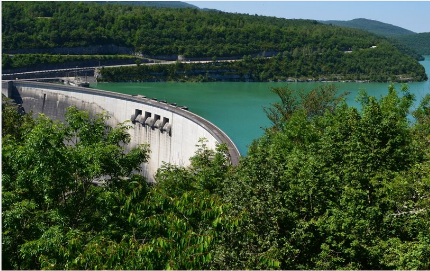
Le Barrage de Vouglans