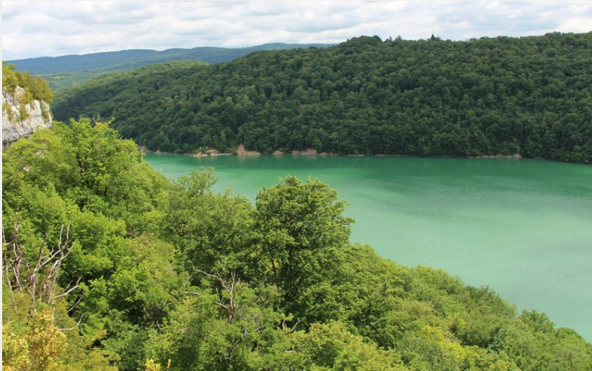
Le lac de Vouglans