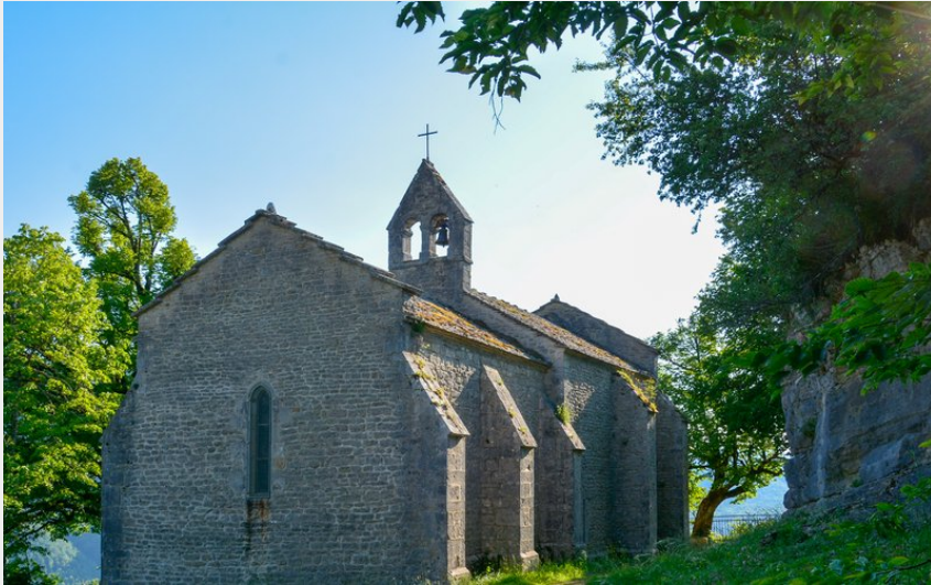
Chapelle Saint-Romain