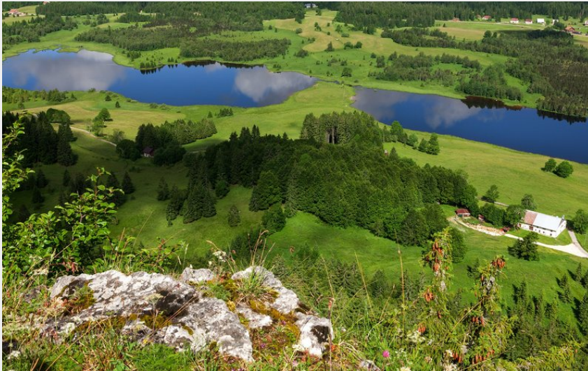
Lacs de Bellefontaine et des Mortes