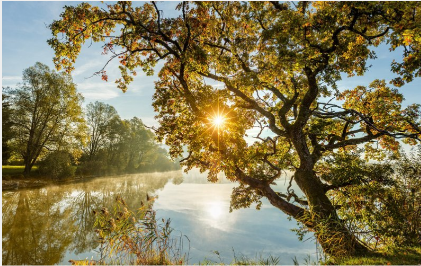
Étangs de la Bresse Jurassienne