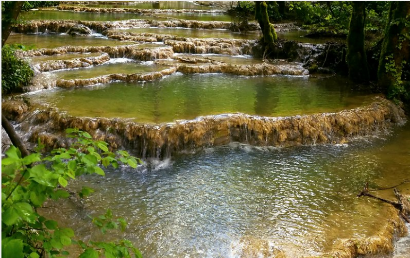
La rivière du Dard