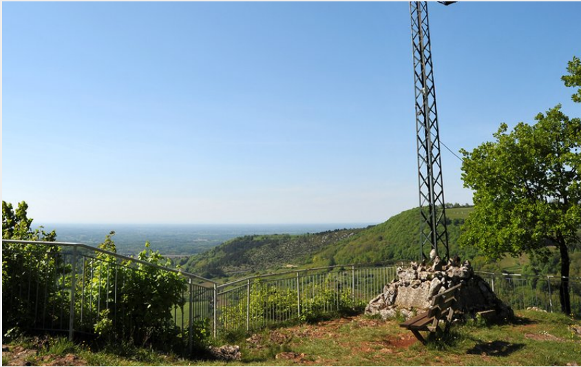
Belvédère du Chanelet