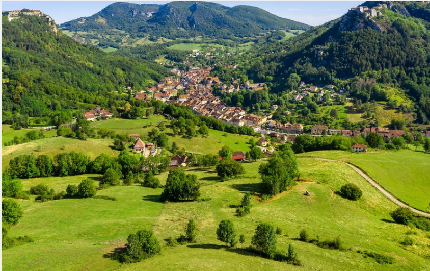
Ville de Salins-les-Bains