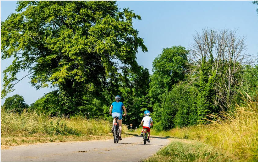
Cyclistes sur la Voie Bressane