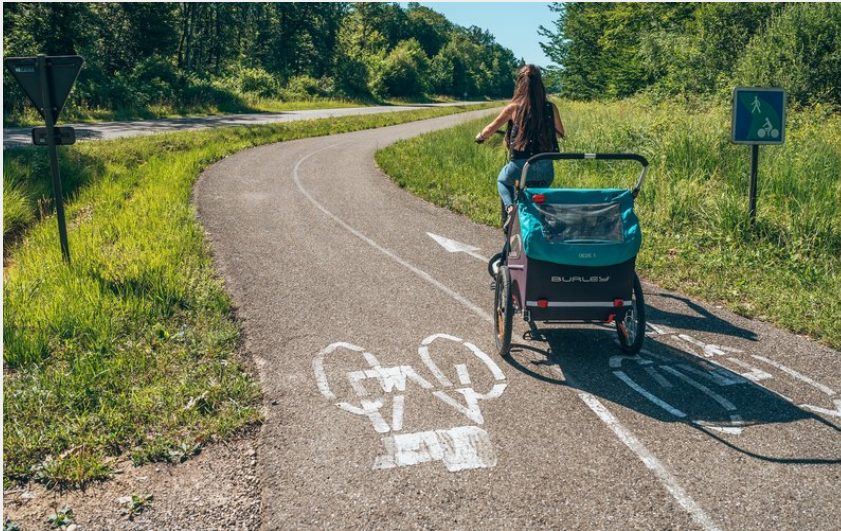
Voie des Salines en forêt de Chaux