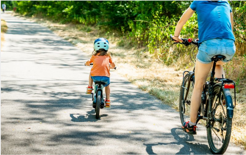
Famille sur la Voie Grévy