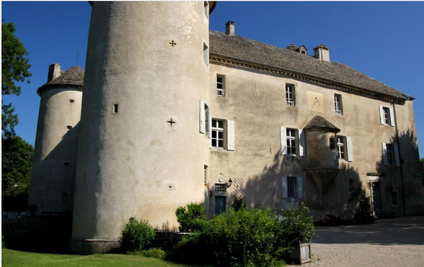
Le Château de Verges