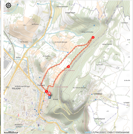
Ville de Poligny

De Poligny, on retient souvent qu'elle est la capitale du comté, mais cette cité de caractère est aussi l'héritière d'une riche histoire et d'une tradition viticole affirmée. À l'embouchure nord de l'imposante reculée de Poligny, la balade vous emmène à la découverte de vestiges et de vignes secrètes aux sublimes panoramas. Vous déambulerez sous la falaise calcaire, matrice des sols de graviers qui font la spécificité des terroirs polinois. Côté vigne vous traverserez successivement les terroirs Monts Martin, Grands Roussots et Chevraudes, trois entités de sols différentes. côté ville, dans le quartier de Charcigny, vous découvrirez l'habitat traditionnel vigneron.