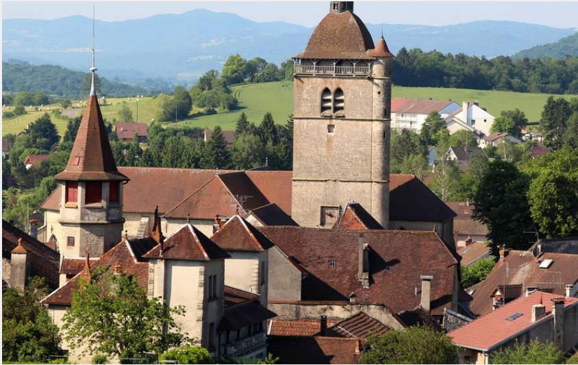
Village et église d'Orgelet