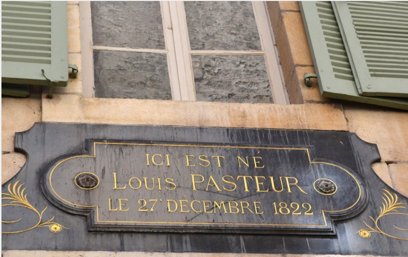
Maison natale de Louis Pasteur