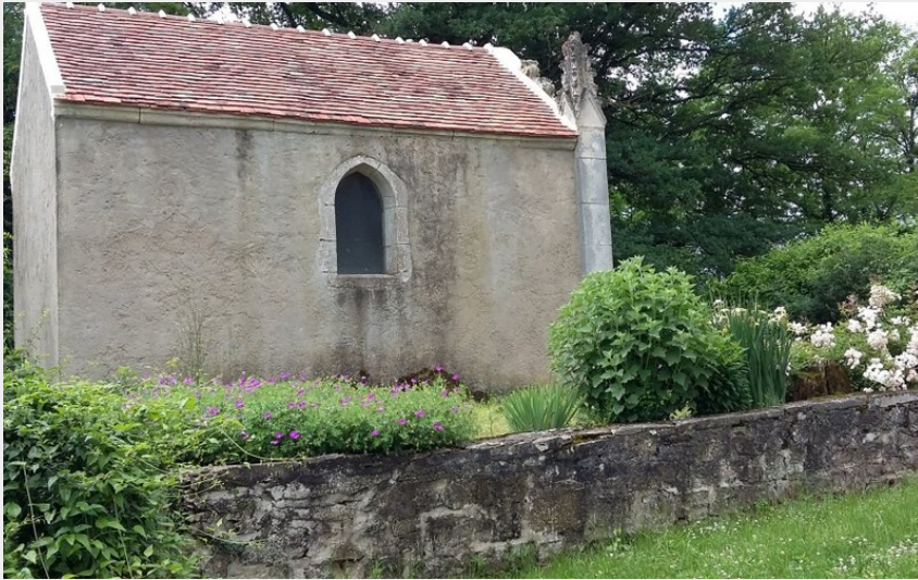
le mt guerin_chapoutote_ (mairie frasne les meulières)