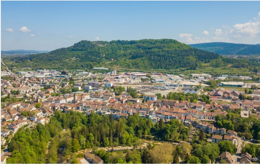
Champagnole-Vue-aerienne Mont Rivel BD©Weezual-CNJ tourisme (©Weezual-CNJ tourisme)