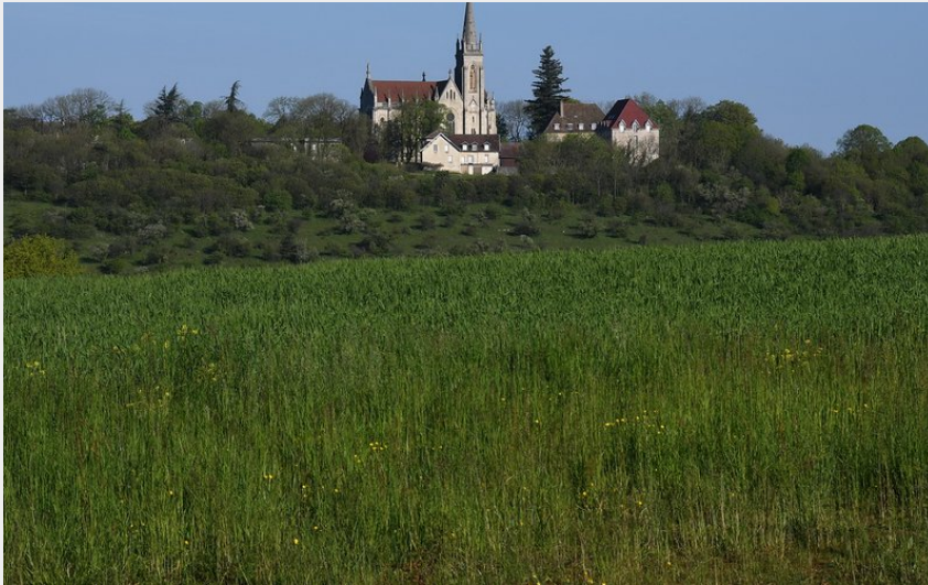
Mont Roland (Jouhe)