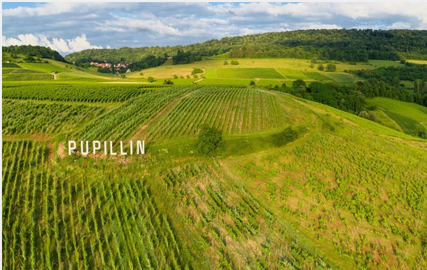
Vignes de Pupillin - vue drone