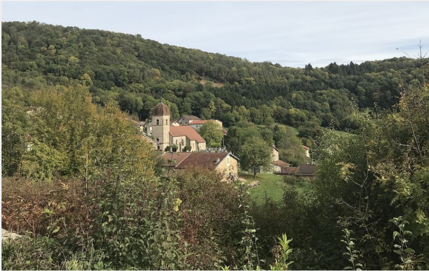
Vue du village de Montagna-le-Reconduit (Jura, France)