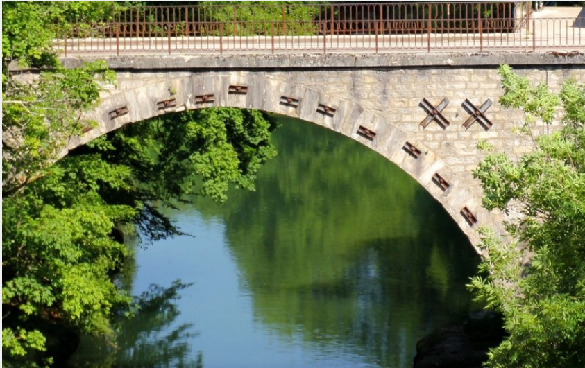
Pont à Champagnole