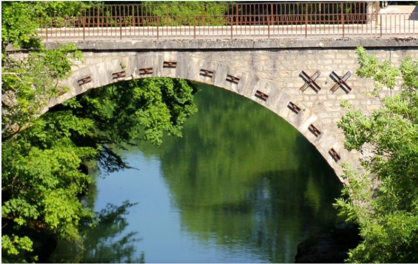
Pont à Champagnole