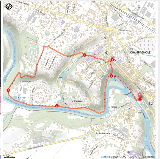
Rivière d'Ain à Champagnole

Ce parcours urbain est idéal pour la famille. Il permet de flâner dans la ville de Champagnole au fil des eaux tumultueuses de l'Ain.