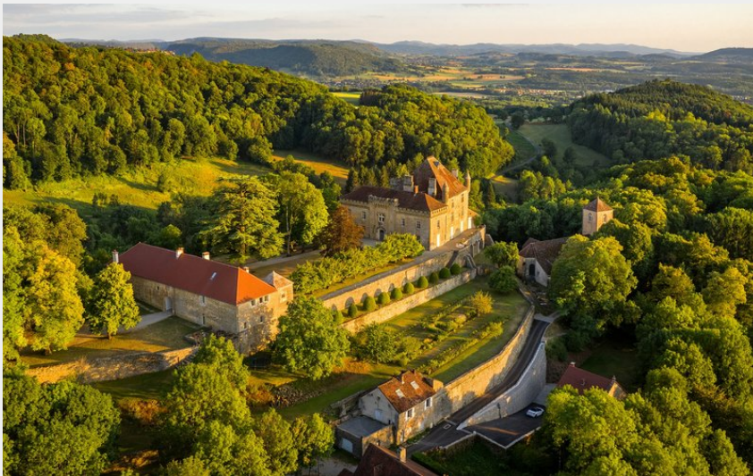
Château de Frontenay