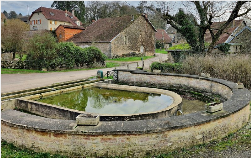
Taxenne, le lavoir-abreuvoir JGS25