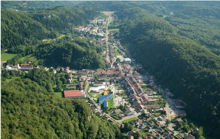
Moirans et ses monts