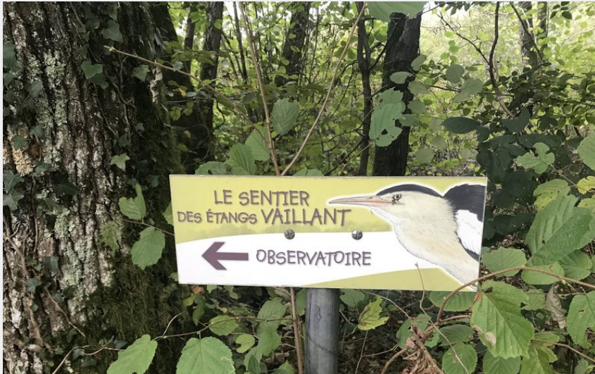
Sentier des Etangs Vaillant